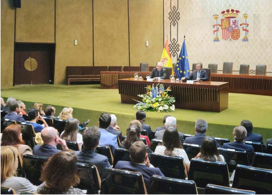
스페인 헌법재판소 특별강연(2023. 4. 24.)