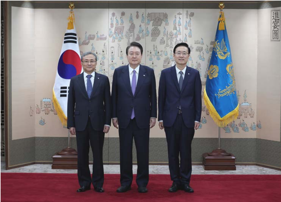
김형두 재판관 임명장 수여식(2023. 4. 6.)