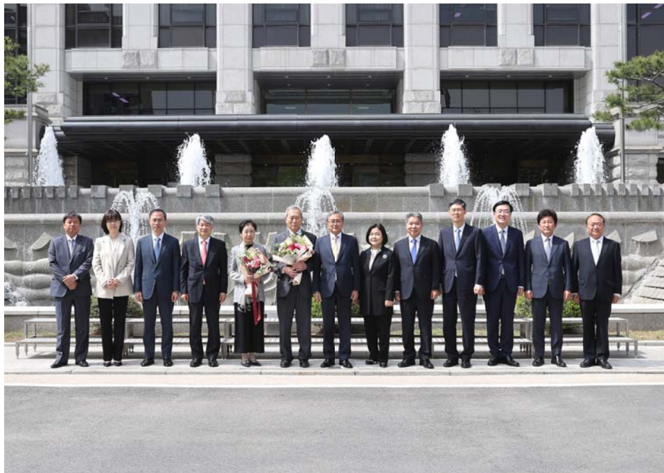
이석태 재판관 퇴임식(2023. 4. 14.)