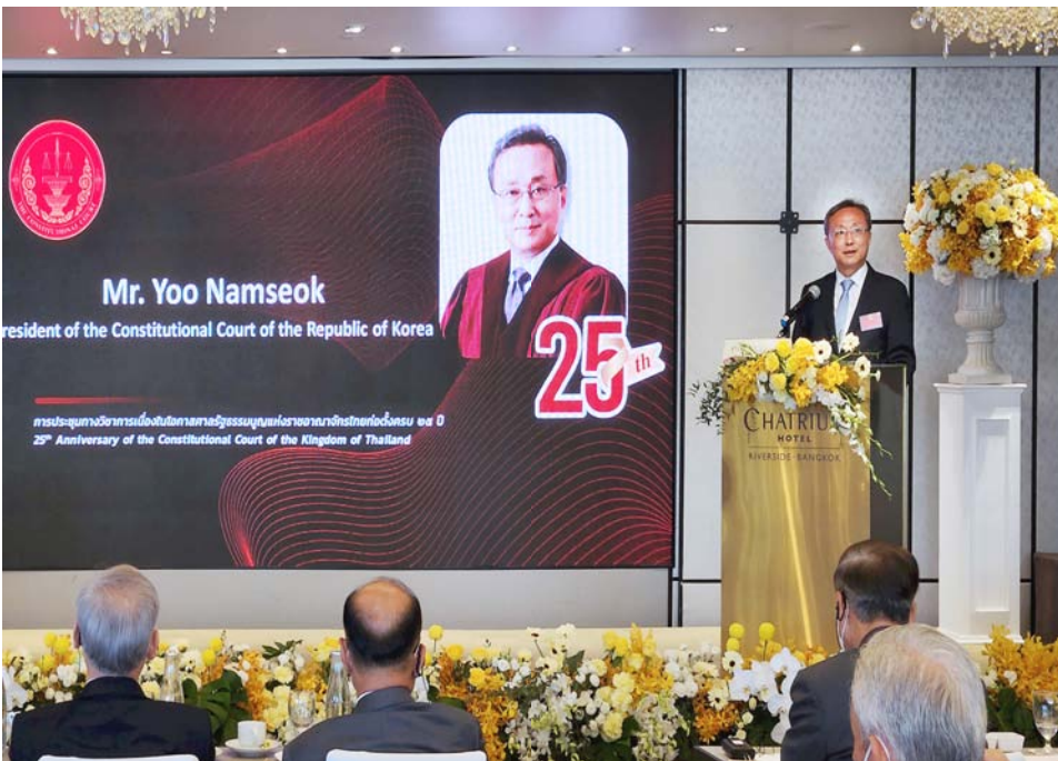
태국 헌법재판소 창립 25주년 기념 국제회의 참석(2023. 4. 10.)