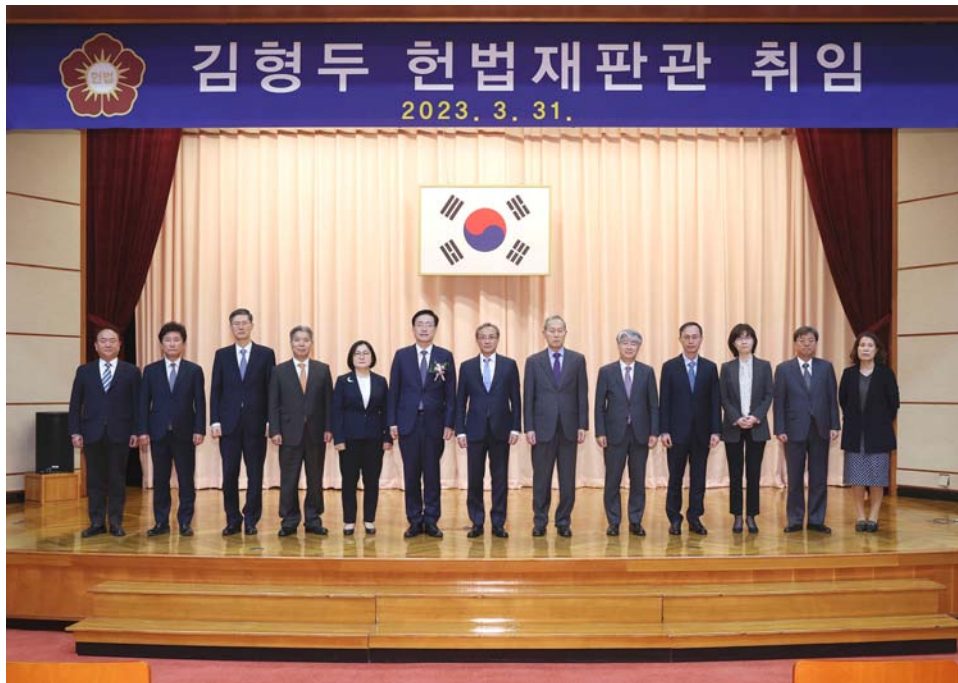
김형두 재판관 취임식(2023. 3. 31.)