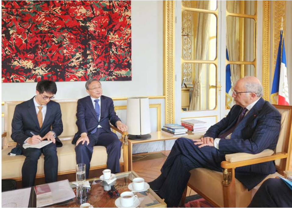
프랑스 로랑 파비우스 헌법재판소장 회담(2023. 4. 21.)