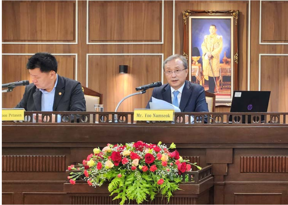
태국 탐마삿 대학교 특별강연(2023. 4. 12.)